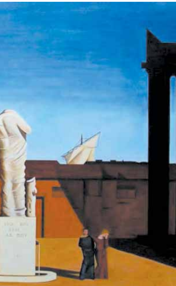
“Enigma di un pomeriggio d'autunno” è stato dipinto nel 1910.